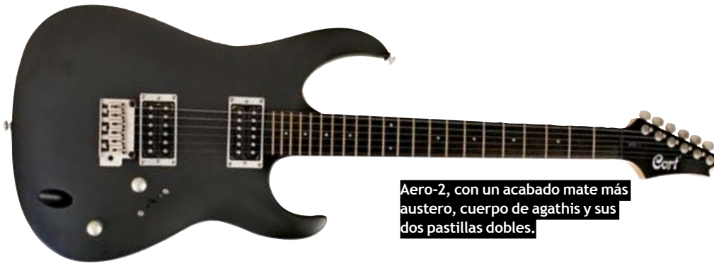
Aero-2, con un acabado mate más austero, cuerpo de agathis y sus dos pastillas dobles.

diapasones de palisandro de marcada veta y sencillos puntos blancos de marcación a lo largo de toda su longitud (el diapason de la 2 es mucho más oscuro y estético, parece casi ébano). Por último las palas puntiagudas, que incorporan sendos clavijeros Die Cast y las credenciales de la firma sobre sus frontales. Cada una de ellas la tienes en 3 acabados diferentes: la 11 en gris carbón, púrpura oscuro y negro cereza; y la 2 en negro satinado, rojo metálico y blanco perla. Destacar el gran nivel de sus acabados, casi sin el más mínimo fallo de ensamble o factura.