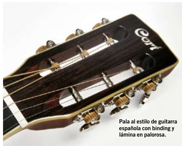
Pala al estilo de guitarra española con binding y lámina en palorosa.

Cuesta no comprar esta guitarra simplemente para tenerla como guitarra de estudio o de diversión absoluta. Muy bien construida, comodidad total, sonido redondo y embaucador. De lo mejor de este segmento en mucho tiempo. 🍷