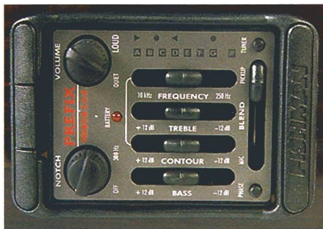
El potente circuito de equalización activa Fishman Premium-SOB con 4 bandas de equalización, frecuencia, fase, notch, volumen y afinador incorporado.

Vista general de esta dreadnought estilo western, con un acabado austero pero excepcional que seduce especialmente por su fina y clara tapa de abeto macizo.