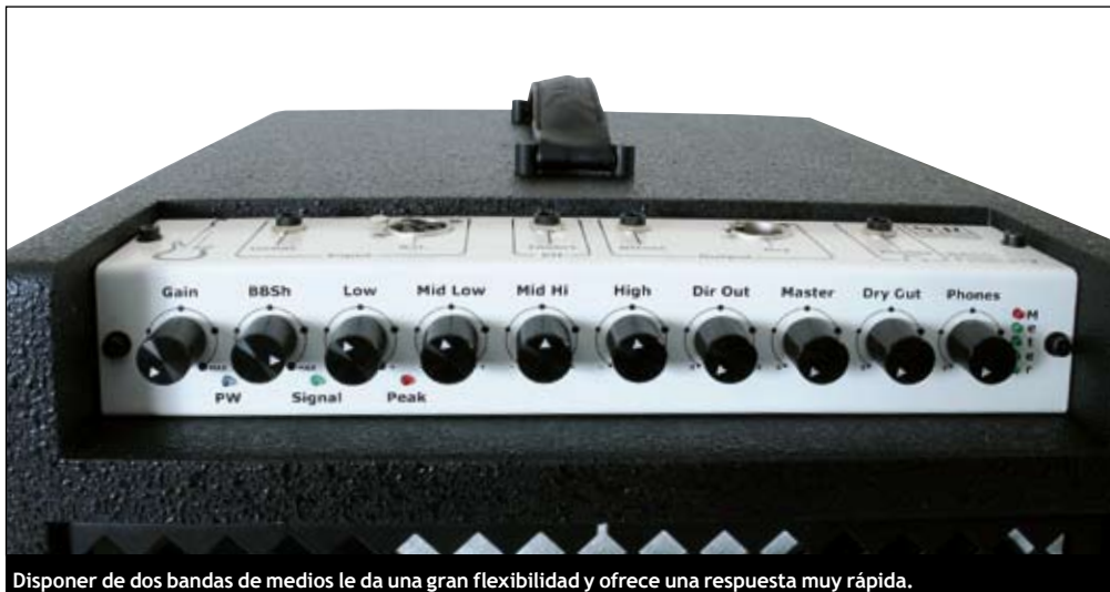
Disponer de dos bandas de medios le da una gran flexibilidad y ofrece una respuesta muy rápida.

La característica que más diferencia a los combos Bass Fidelity de modelos similares de otras marcas es el control BBSH que modifica la respuesta de graves: cuando los subes a tope la pegada se vuelve impresionante